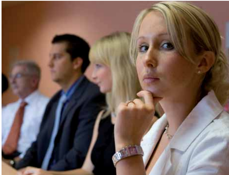
Jüngere Arbeitslose fühlen sich oft unzureichend informiert.

Nicht zu unterschätzen ist die Rolle von Freunden, Verwandten und Bekannten in dieser Frage: Jede(r) fünfte Arbeitslose (21 Prozent) vertraut auf Informationen von dieser Seite.