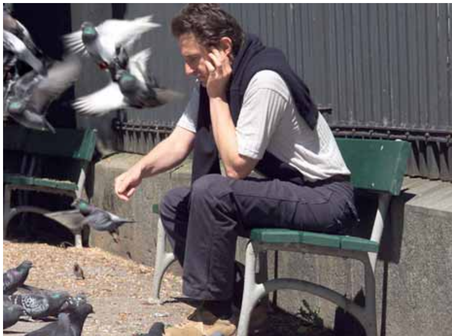
Finanzielle Sorgen trüben die Freude am Leben

Für Arbeitnehmer bedeutet der Verlust des Arbeitsplatzes einen stärkeren Einschnitt als für Arbeitnehmerinnen: 72 Prozent der Männer und 56 Prozent