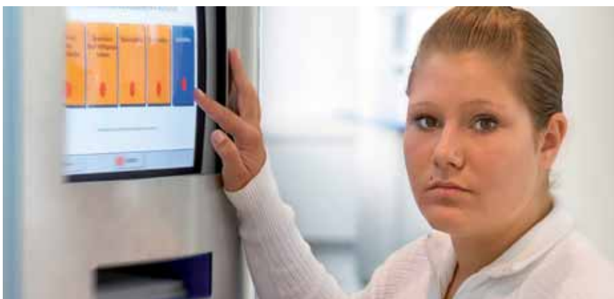
Ausweg Weiterbildung? Arbeiter/-innen sind benachteiligt

Die gesammelten Daten des Arbeitsklima Index stehen in der Online Datenbank für Ihre Auswertungen bereit. Die Datenbank finden Sie unter www.arbeitsklima.at . Klicken Sie hin!