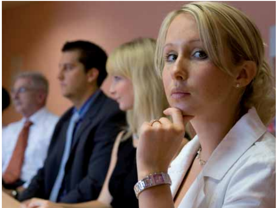
Jüngere Arbeitslose fühlen sich oft unzureichend informiert.

Nicht zu unterschätzen ist die Rolle von Freunden, Verwandten und Bekannten in dieser Frage: Jede(r) fünfte Arbeitslose (21 Prozent) vertraut auf Informationen von dieser Seite.