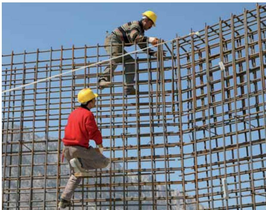
Migranten haben weniger Berufschancen als Beschäftigte ohne Migrationshintergrund

nur auf 95 Indexpunkte, die zweite Generation hingegen auf 104 Punkte. Im Ausland geborene Arbeitnehmer/-innen sind mit ihren Rechten gegenüber dem Dienstgeber wenig zufrieden – Türken zu 55 Prozent, (Ex-)Jugoslawen zu 47 Prozent. In der zweiten Generation nimmt die Unzufriedenheit ab (Türkei: 33 Prozent, Ex-Jugoslawen 28 Prozent). Etwa gleich hoch ist die Zahl der unzufriedenen Arbeitnehmer/-innen ohne Migrationshintergrund mit 29 Prozent.