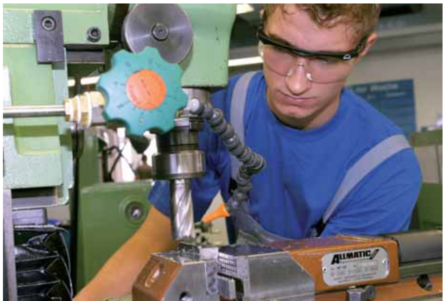
Lehrlinge in Österreich: Statt Zuversicht immer öfter Frust

Lehrlinge stellten Vorgesetzten und Ausbildnern bisher immer ein sehr gutes Führungszeugnis aus. Vor der Krise etwa waren 80 Prozent damit zufrieden, seither ist der Wert auf 74 Prozent gesunken. Bei den übrigen Berufseinsteigern stieg der Wert von 70 auf 73 Prozent. Die Belastung durch technische und organisatorische Änderungen hat bei Lehrlingen in den vergangenen Jahren deutlich zugenommen – von zehn Prozent in den Jahren 2006/07 auf aktuell 14 Prozent. Bei den übrigen Berufseinsteigern ist der entsprechende Wert mit acht Prozent gleich geblieben.